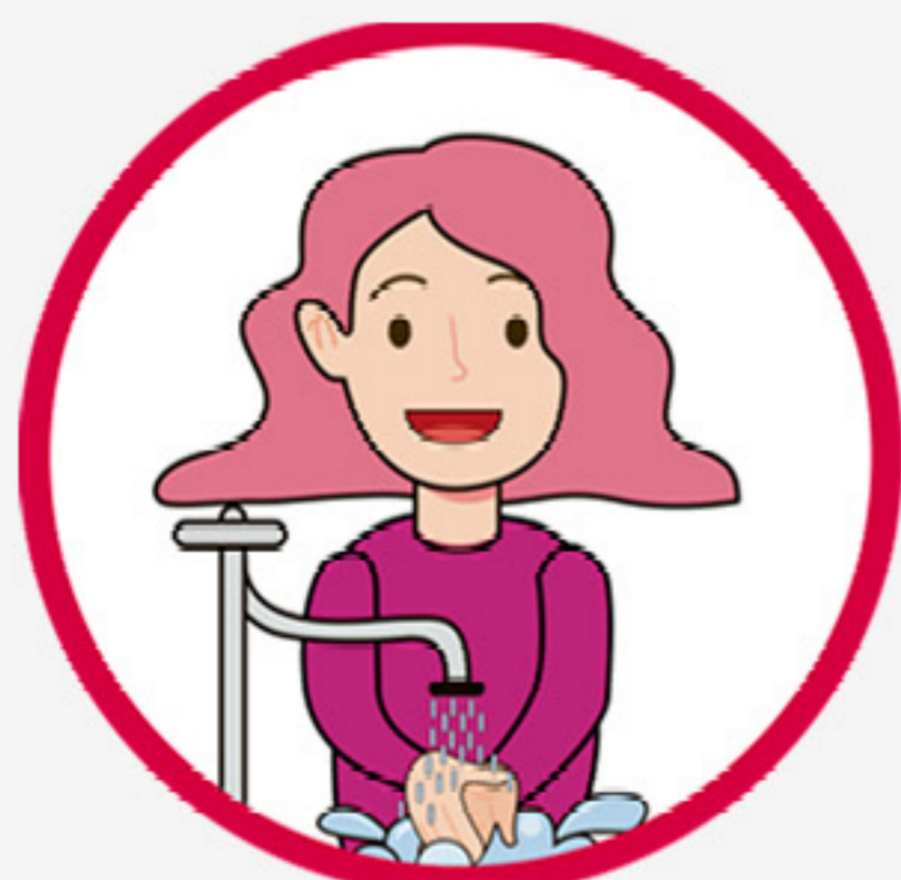
Lavado de manos