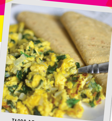
TACOS DE HUEVO CON VERDURA Nutrimentos: Proteína, hierro, grasa, fibra, calcio.